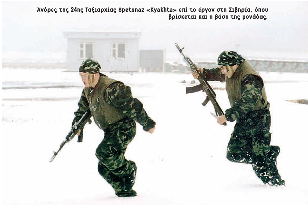
Άνδρες της 24ης Ταξιαρχίας Spetsnaz «Κυακhta» επί το έργον στη Σιβηρία, όπου βρίσκεται και η βάση της μονάδας.

Οι πρώτες δυνάμεις ειδικών καθηκόντων που δημιουργήθηκαν το 1958-60 αποτελούν σήμερα την αιχμή του δόρατος του Ρωσικού Στρατού. Δεν έχουν μεγάλες ομοιότητες με αμερικανικά αντίστοιχα τμήματα, διότι η αντίληψη βάσει της οποίας έχουν δημιουργηθεί και εξελιχθεί διαφέρει θεμελιωδώς από αυτή των Αμερικανών. Η βασικότερη ίσως διαφορά είναι ότι πρόκειται στην κυριολεξία για ομάδες ειδικών καθηκόντων, που δύσκολα