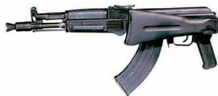
Η νέα γενιά του θρυλικού Kalashnikov. Παράγεται σε τρεις εκδόσεις: ως AK-102 στα 5,45 χιλ., AK-104 στα 7,62 χιλ. και AK-105 στα 5,45 χιλ. Φυσικά αξιοποιούνται και οι τρεις εκδόσεις στη «δεξαμενή» οπλισμού των Spetsnaz.