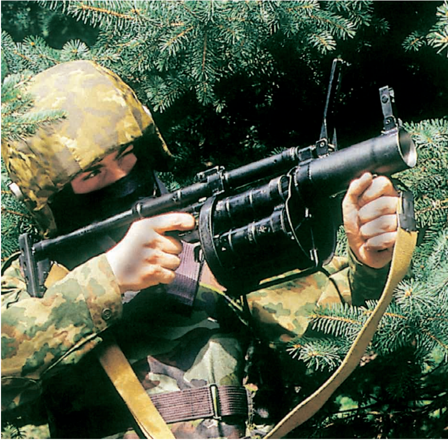
Με το δάκτυλο στην σκανδάλη ενός εκτοξευτή βομβιδών των 40 χιλ. 6G-30 GNOM.

χρησιμοποιούνται εκτός των καθηκόντων αυτών (έγινε μόνο τα τελευταία χρόνια, εξαιτίας των μεγάλων προβλημάτων εκπαίδευσης και επανδρώσεως του Ρωσικού Στρατού επί Γιέλτσιν, και την κληρονομιά που παρέλαβε ο Πούτιν στην πρώτη του θητεία). Ελέγχονται άμεσα από την GRU, δεν έχουν ειδικά ονόματα ή στολές, δεν έχουν ειδικά στρατόπεδα, και συνήθως αναμειγνύονται με τις αερομεταφερόμενες δυνάμεις. Το μόνο που μπορεί να προδώσει κατά περίπτωση την ταυτότητά τους είναι ο ανοιχτόχρωμος μπλε μπερές που φέρουν μερικές φορές ή ο ιδιαίτερος εξοπλισμός που έχουν στις αποστολές τους (π.χ. δυτικός εξοπλισμός και οπλισμός κατά περίπτωση). Σε επιχειρησιακή κατάσταση κάθε μέλος της ομάδας φέρει φόρτο 40-50 κιλά (πυρομαχικά, λίγα τρόφιμα και νερό, υλικά της ομάδας).