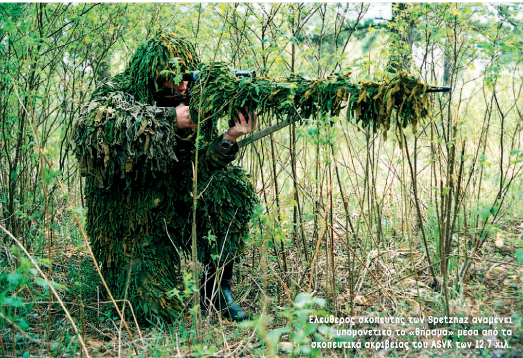
Ελεύθερος σκοπευτής των Spetsnaz αναμένει υπομονετικά το «θήραμα» μέσα από τα σκοπευτικά ακριβείας του ASVK των 12,7 χιλ.