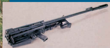
Τυφέκιο ελεύθερου σκοπευτή OSV-96 των 12,7 χιλ. Παρατηρήστε τον εργονομικό τρόπο αναδίπλωσης για εύκολη μεταφορά.