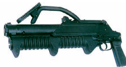
Εκτοξευτής GM-94 των 43 χιλ. χωρητικότητας τεσσάρων βομβιδίων.